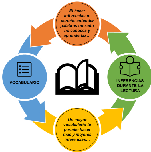
Figura 1. Modelo de relación recíproca entre vocabulario e inferencias.