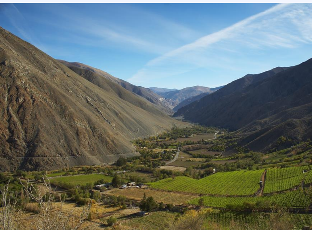
Alto del Carmen

El Servicio Local de Educación Pública Huasco es responsable de la calidad y equidad de los aprendizajes y del desarrollo integral de cada estudiante de los establecimientos públicos de las comunas de Alto del Carmen, Vallenar, Freirina y Huasco . Administra 55 establecimientos educacionales y 8 jardines infantiles, juntos reúnen una matrícula de 13.367 estudiantes de nivel parvulario, básico, medio y educación de adultos.